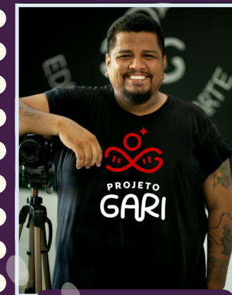
Audiovisual Marcelo Ramos