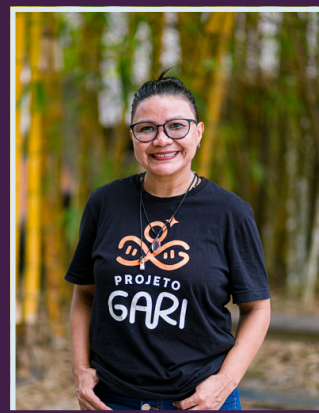
Apoio Técnico e Logístico Dani Saterê